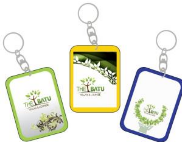
Gambar 9 Final Artwork Key Chain

Final Artwork desain merchandise key chain ini berbahan dasar acrylic sheet dengan ukuran 3x5 cm. Warna desain yang digunakan adalah hijau, kuning, biru, dan beberapa unsur desain yang disesuaikan dengan logo The Batu Hotel & Villas menjadi kesatuan yang balance .