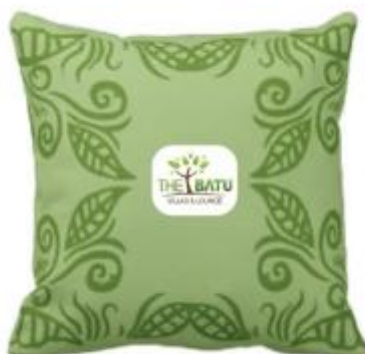
Gambar 4 Final Artwork Cushion

Final Artwork desain merchandise (final artwork) merchandise cushion The Batu & Villas menggunakan kain katun berukuran 30 x 30 cm yang dibuat dari serat kapas alami, oleh karena itu kain katun nyaman saat digunakan. Teksturnya halus karena ditenun dari benang yang mempunyai ukuran kecil. Pemilihan background berwarna hijau, motif daun dan dilengkapi dengan logo The Batu Hotel & Villas yang memberikan kesan alami.