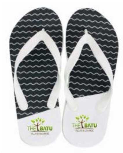
Gambar 8 Final Artwork Slippers