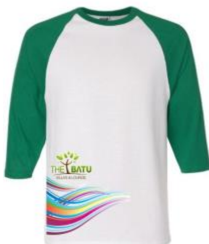
Gambar 7 Final Artwork Shirt

Final Artwork desain merchandise shirt menggunakan warna dasar putih, hijau, logo, dan beberapa elemen garis yang berwarna agar desain ini juga terlihat lebih simple dan menarik.