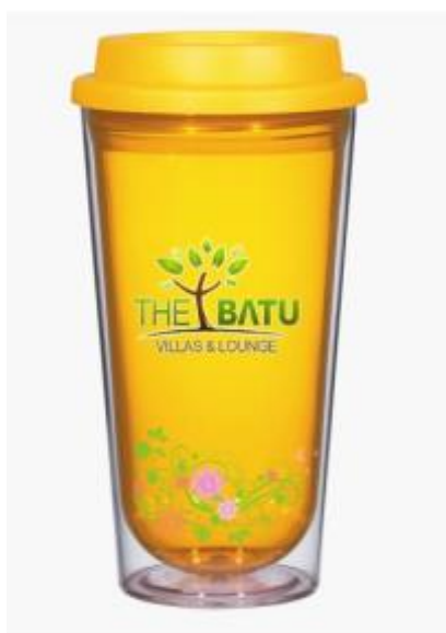
Gambar 5 Final Artwork Tumbler Cup

Final Artwork desain merchandise tumbler cup ini menggunakan warna kuning sebagai background dan dipadukan dengan unsur bunga, daun dan dilengkapi dengan logo. Spesifikasi tinggi 20 cm menggunakan material bahan keramik.