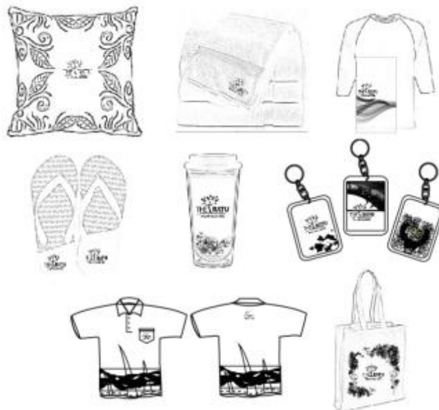
Gambar 1 Layout Kasar

Layout kasar adalah proses desain yang masih dalam bentuk sketsa. Layout kasar sendiri dibuat untuk menjadi acuan dalam tahap desain yang dilakukan pada tahap komputerisasi.