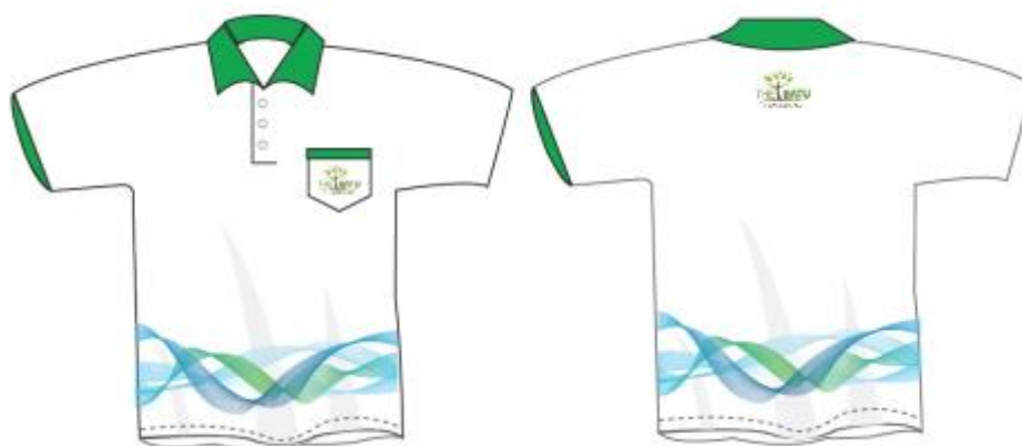
Gambar 10 Final Artwork Polo Shirt