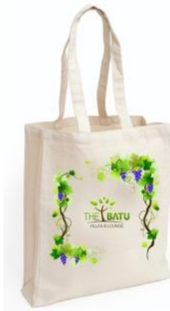
Gambar 3 Final Artwork Goodie Bag

Berikut ini adalah hasil akhir ( final artwork ) merchandise goodie bag The Batu & Villas dilengkapi dengan logo dan beberapa elemen desain yang memberikan kesan natural. Godie Bag ini terbuat dari bahan canvas dengan ukuran 25 x 35 cm.