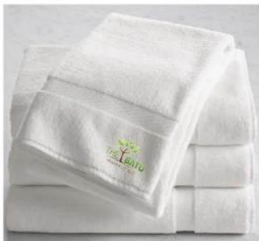
Gambar 6 Final Artwork Towel