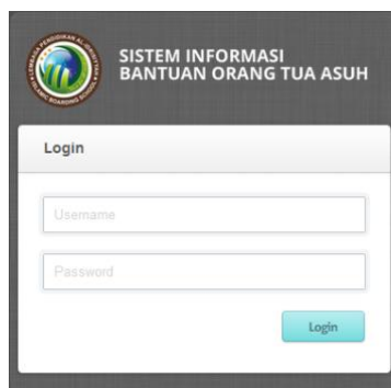
Gambar 3. Tampilan Login

Pada tahapan implementasi sistem dibuat berbasis web menggunakan bahasa pemrograman PHP dan basis data MySQL. Untuk menjalankan aplikasi ini pengguna harus masuk terlebih dahulu ke halaman login. Halaman login ini berfungsi menerima masukan berupa username dan password untuk kemudian akan diverifikasi apakah username dan password tersebut telah valid. Jika benar, maka akan masuk ke tampilan Menu Utama . (lihat Gambar 3).