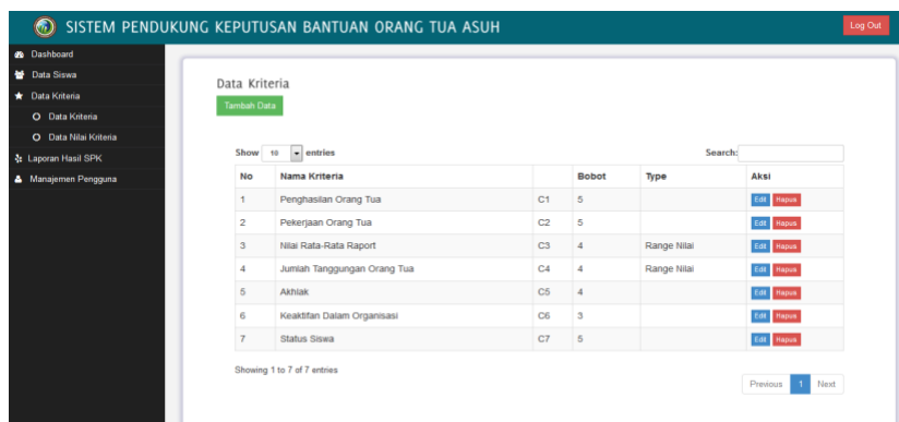
Gambar 5. Halaman Pengaturan Data Kriteria

Pada gambar 5, pengguna bisa menginputkan Nama Kriteria, Bobot dan Type. Nama kriteria yang diinputkan pada SPK penerima bantuan orang tua asuh ini meliputi : Penghasilan orang tua, pekerjaan orang tua, nilai rata-rata raport, jumlah tanggungan orang tua, akhlak, keaktifan dalam organisasi dan status siswa.