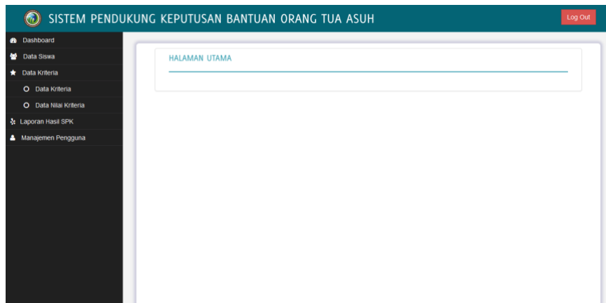
Gambar 4. Tampilan Halaman Utama

Halaman Utama pada aplikasi ini terdiri dari 4 bagian, yaitu menu Dashboard, menu Data Siswa, menu Data Kriteria meliputi menu Data Kriteria dan menu Data Nilai Kriteria, menu Laporan dan menu Manajemen Pengguna. Tampilan menu utama dapat dilihat pada gambar 4.